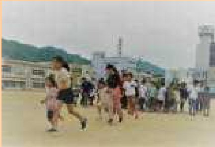
子どもの振り返りより

5月26日(木), 延期されていた訓練を実施しました。自分の身は自分で守ることができるように, 放課後, 学校が休みの日でも避難できる備えをしておきましょう。